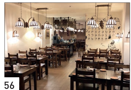
LES TUPINIERS DE LYON. Les céramiques de Gumri à l'honneur.